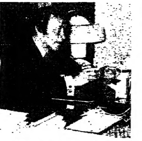
السيد احمد عصمان رئيس الحكومة المغربية

ان هذه المرحلة الجديدة من الحياة الديمقراطية ستكون لها طبيعة الحال تالي على السياسة السياسية والاقتصادية والاجتماعية في البلاد ، لك ان ظهور ككل سياسي جديد ، وهو لفسك الذي يسمى الان بالاحرار الى جانب الاحزاب القائمة ، سيكون عنصرا فعلا في تاطر المجتمع ولي تسيير شؤون البلاد داخل المؤسسات الديمقراطية .